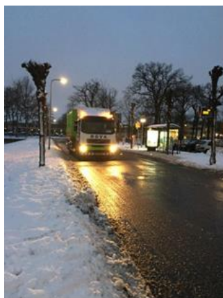
Wachten op de truck op zelf weer eens te boppen

Het is maar één dinsdag. Het duurt maar van 08:00 uur tot ca. 14:00 uur. Iedereen die het al gedaan heeft, vond het erg leuk. En heeft er op de dag zelf, maar ook nog lang daarna een heel goed gevoel over. Omdat het geld oplevert voor de Ouderraad die er leuke dingen mee doet voor onze kinderen. Dat is andere koek hè?! Dat is nog eens een goed voornemen. En 100% haalbaar. Word je blij van.